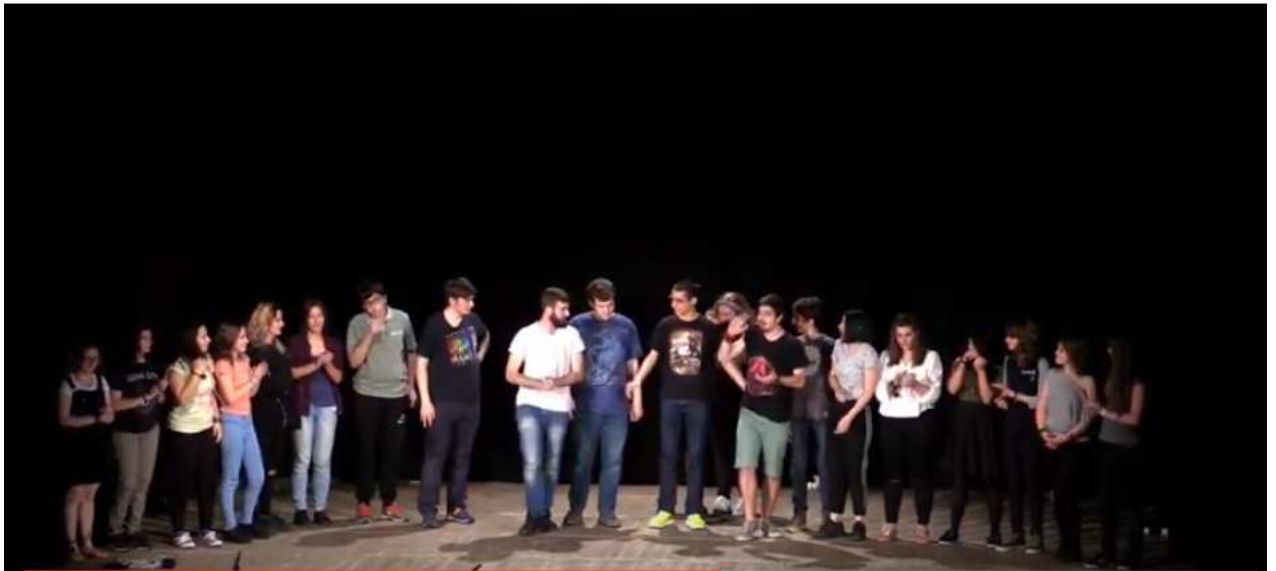
Spettacolo c/o il Teatro Nuovo di Treviglio (TNT)