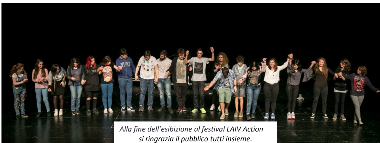
Alla fine dell'esibizione al festival LAIV Action si ringrazia il pubblico tutti insieme.