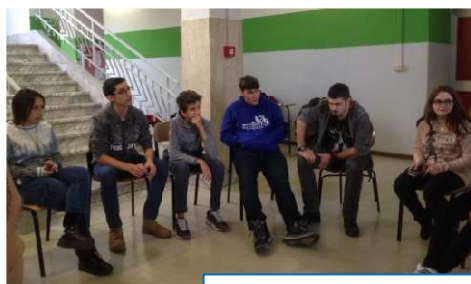
... persino sulle scale